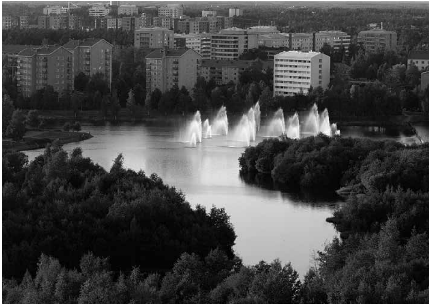
Kuohu. Oulujoen geysirit tiirailtuina tuomiokirkon tornista. Alvar Aalto suunnitteli suihkut 1940-luvulla, korvaamaan Merikosken kuohunnan uuden voimalaitoksen valmistuttua. 1950-luvulla rakennetut, jo tiensä päähän tulleet kuusi isoa ja kuusi pientä suihkua korvattiin vuonna 2001 kymmenellä isolla ja seitsemällä pienemmällä suihkulla. Samalla myös Hupisaarten edustalle istutettiin suihkuja.

Spray. The geysers in the Oulu River, looked down on from the cathedral tower. These fountains were designed by Alvar Aalto in the 1940s to replace the spray that had previously risen from the Merikoski rapids. The original six tall fountains and six smaller ones installed in the 1950s had reached the end of their useful life by 2001 and were exchanged for a new set of ten large and seven small ones. At the same time new fountains were provided off the shore of the Hupisaari area.