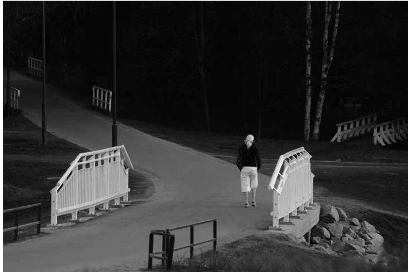
Valinta. Hupisaarten puiston siimekseen kätkeytyy mielenrauha. Kaupunki hengittää.

Which way? Peace of mind can always be found beneath the trees of the Hupisaari Park, a breathing space in the city centre.