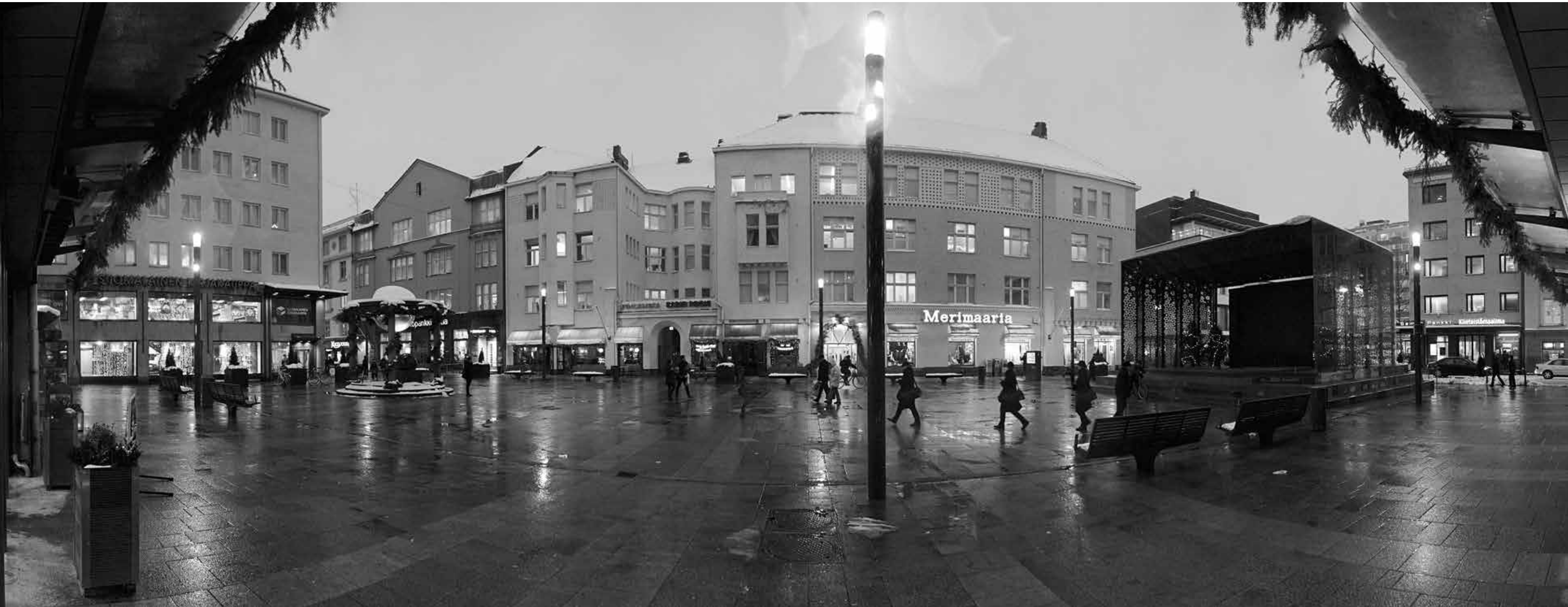
Ensimmäinen lumikuukausi Rotuaarilla. Rotuaarin alle vuonna 2011 rakennettu sulassapitojärjestelmä muutti liukastelun lumisissa maisemissa syksyisempiin olosuhteisiin.