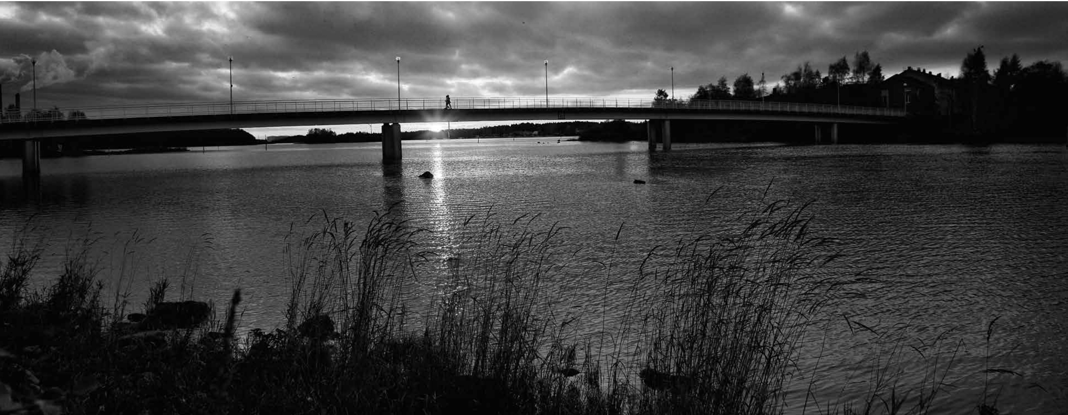
Kaksi horisonttia. Pikisaaren kävelysilta kylpee iltavalossa.