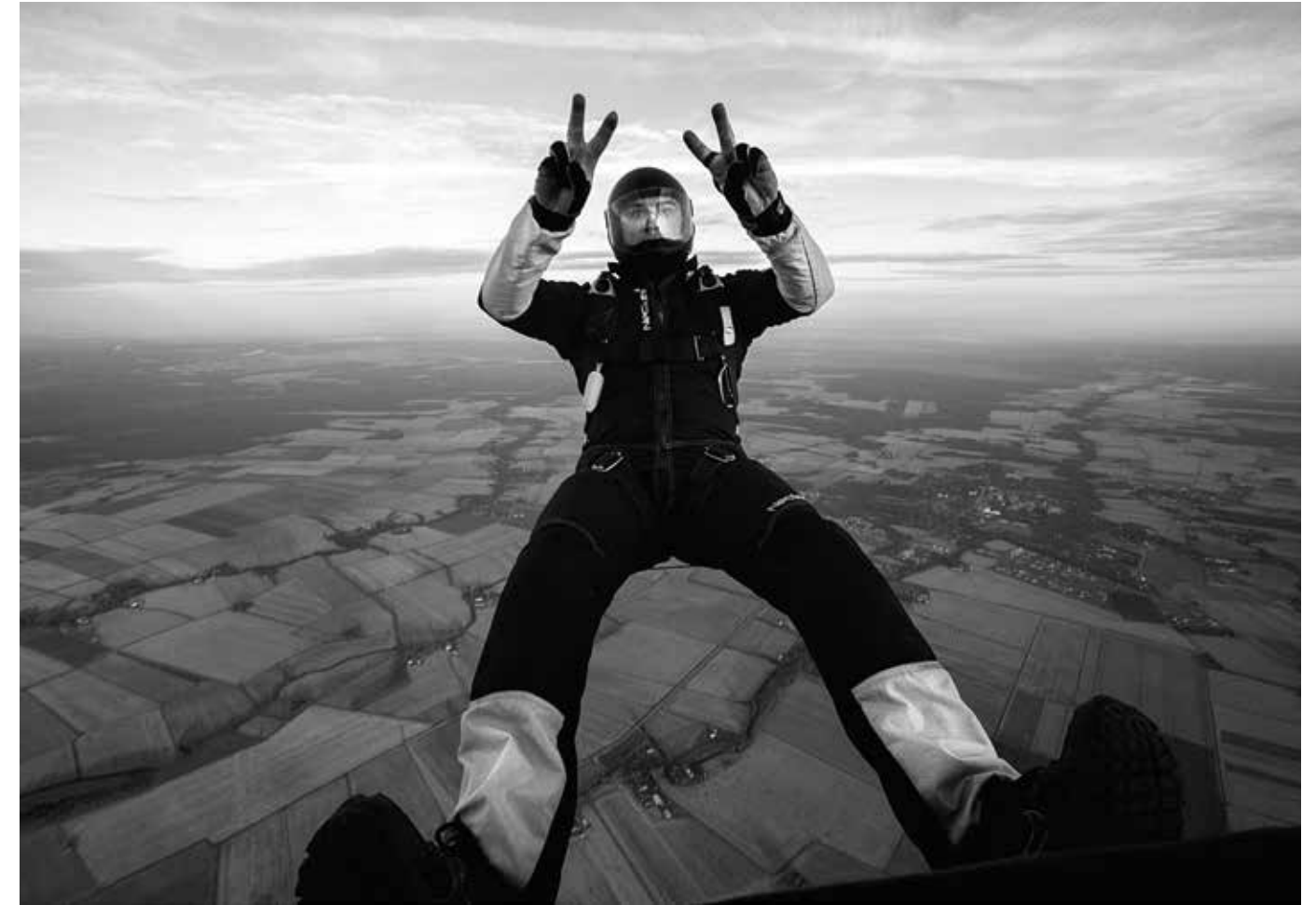
Hyppy syksyyn! Tyrnävän niityt, edessä Limingan- ja Oulunlahti. Vuoden 2013 alusta voimaan astuneessa kuntaliitoksessa Haukipudas, Kiiminki, Oulu, Oulunsalo ja Yli-Ii liittyivät yhteen muodostaen uuden Oulun, joka nousi väkiluvultaan Suomen viidenneksi suurimmaksi kaupungiksi.

Spray. The geysers in the Oulu River, looked down on from the cathedral tower. These fountains were designed by Alvar Aalto in the 1940s to replace the spray that had previously risen from the Merikoski rapids. The original six tall fountains and six smaller ones installed in the 1950s had reached the end of their useful life by 2001 and were exchanged for a new set of ten large and seven small ones. At the same time new fountains were provided off the shore of the Hupisaari area.