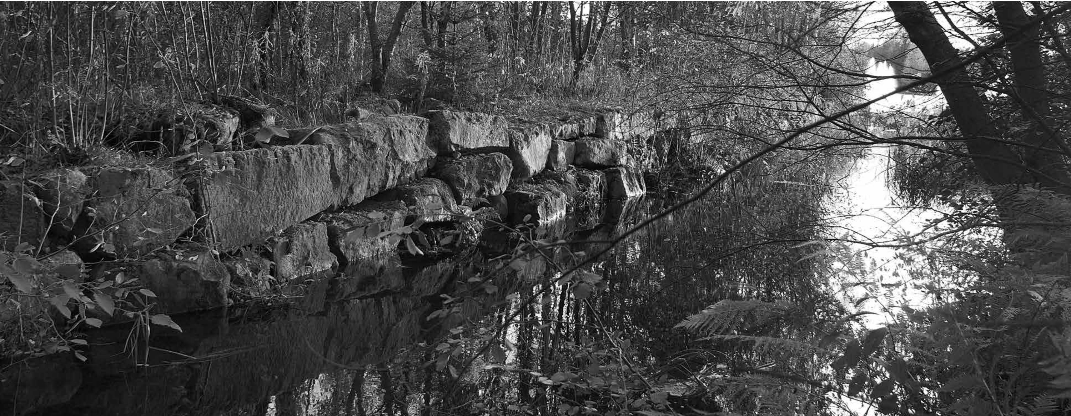
Tyvenellä. Syksyisen Rönkönväylän möljiä Hupisaarilla.