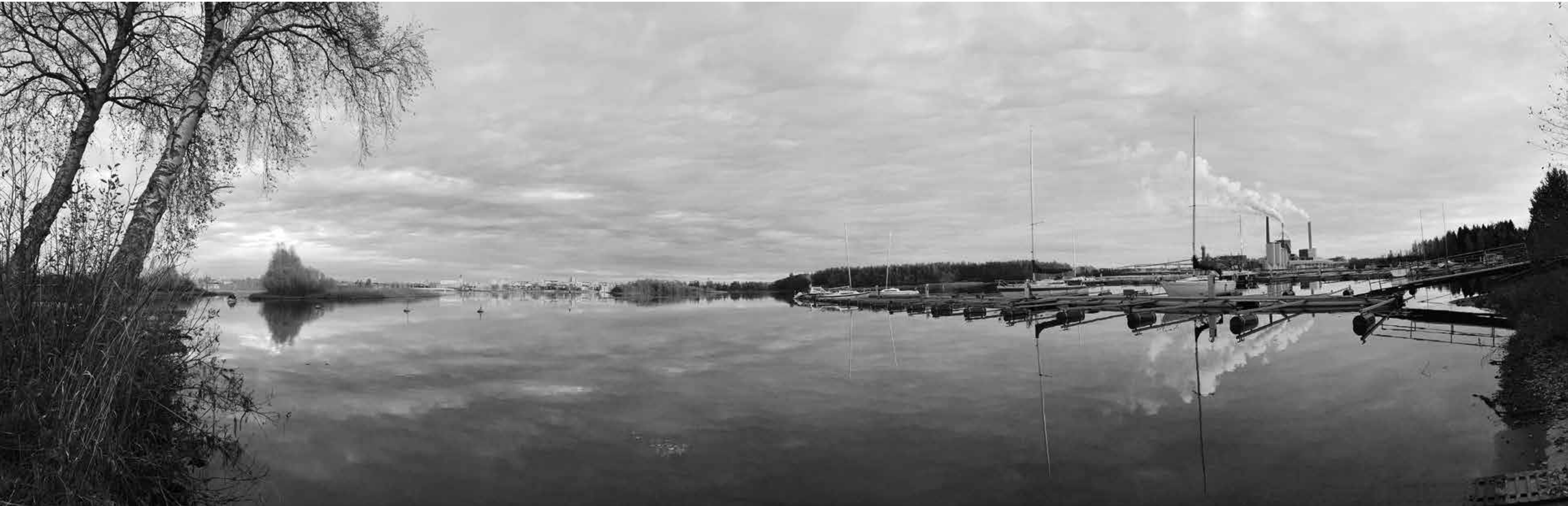
Viimeiset vesillä. Lokakuussa 2015 kaupungin profiilin tasaisuus nousee esiin Hietasaasen Johteenpookista tarkasteltuna. Uutta keskustan rakentamista on kuitenkin havaittavissa vuosia kestäneen hiljaiselon jälkeen.