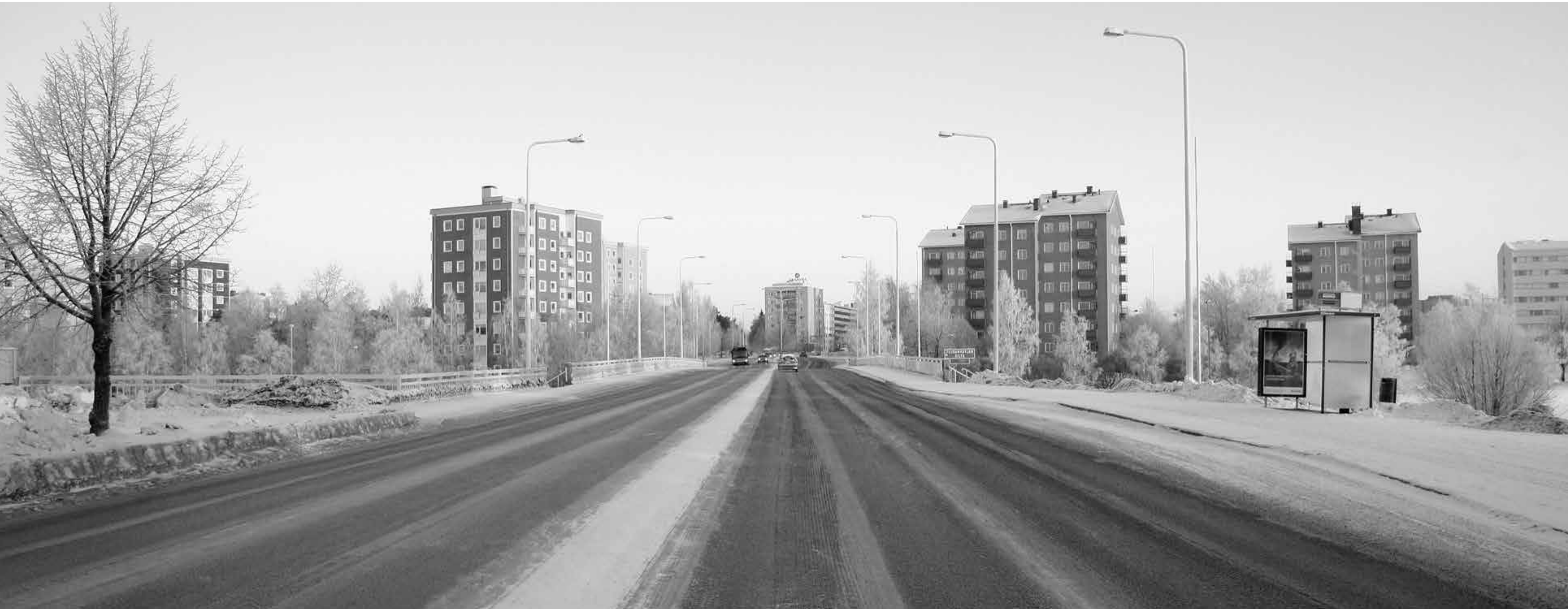
Toivoniemi. Merikoskensillat ja Alvar Aallon kaavoittama suisto.