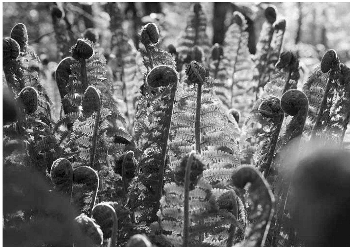
Herääminen. Saniaisenalkuja kesän korvalla Ainolanpuistossa. Näiden pikkuisten lisäksi Hupisaarilla kasvaa myös erikoisempia kasveja, muun muassa puisto- ja likusterisyreeni, lehto- ja punasaarni, japaninmarjakuusi, sekä Oulun suurin laakeripoppeli.

The awakening. New ferns emerging in the Ainola Park as summer approaches. There are other, more esoteric plants growing in the Hupisaari area as well: rare varieties of lilac, the European ash and the North American red ash, the Japanese yew and the largest laurel-leaf poplar in Oulu.